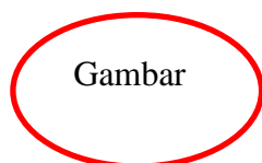
Gambar 1. Judul gambar (Sumber:.....)

Penggunaan gambar, peta, dan atau foto diberi nomor dan judul di bawah gambar. Cantumkan sumber gambar di bawah nomor dan label gambar! Contoh penulisan tergambar pada gambar 1.